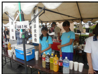
▲模擬店のお手伝い(美術部)

8月27日(日)、夏の最後を飾る「ふれあい広場“元気2017”」が相生公民館で開催され、相生地区からたくさんの方が参加しました。相生中からも吹奏楽部がステージ発表に、美術部が作品展示と関係諸団体による模擬店のお手伝いにと大活躍してくれまじりました。また、PTA実行委員会の皆様も例年のようにカレーづくりと販売に取り組んでくださり、好評を博していました。参加してくださった皆様、楽しいひとときをありがとうございました。