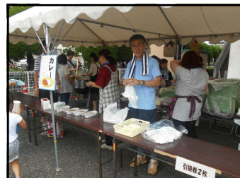
▲PTA役員の皆様によるカレーづくり、販売