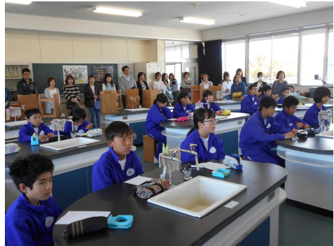
▲1年生の授業参観（理科）

保護者の皆様に学校にお迎えした生徒たちは、いつもに比べてやや照れくさそうな顔をしていましたが、うれしそうな表情を垣間見せてくれました。お忙しい中、本当にありがとうございました。